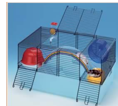
Ferplast Rainbow 59 x 36,5 x30