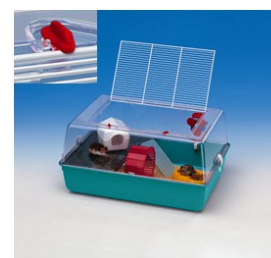
FERPLAST Mini Duna 55x39x27