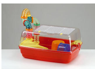
FOP Criceto Bernie Prestige 53*38*25,5