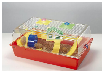
FOP Criceto Charlie Prestige 75*47* 33