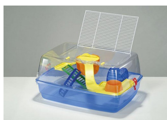
FOP Criceto Bernie Deluxe 53x38x25,5