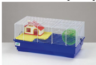
FOP Criceto Duffi 58*32*45